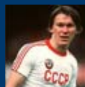
Футболист: Олег Блохин