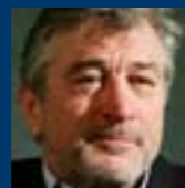
Артист: Роберт де Ниро

Тренеры запрещают тебе видеться с супругой перед матчем?